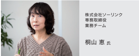
株式会社ソーリンク 専務取締役 業務チーム

スク対策の一環としてのセキュリティ強化要求が高まり、一定の水準に達しない場合、取引が継続できないとの意向が示されました。当社としても万一、インシデントが起きて取引先の製造ラインを止めてしまうような事態になれば、取引先にも多大な迷惑をかけてしまいます。ある程度費用をかけてでも、しっかり対策するという方針を定めました」