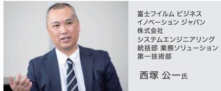
富士フイルム ビジネス イノベーション ジャパン 株式会社 システムエンジニアリング 統括部 業務ソリューション 第一技術部

「情報漏えいを防ぐという目的に合う、高いセキュリティ性を持つ多要素認証であることに加え、約1か月の検証の間、既存サービスで多発していた認証の不具合も起こりませんでした。コストの面からも、海外製品に比べお客様にとって最適な仕組みと判断していましたし、OneGateはデジタル証明書の配布や管理が容易で、お客様側で負荷なく運用いただけると感じた点も、決め手となりました」